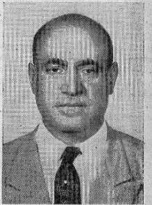
Doctor Solís Quiroga